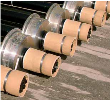
Formschlüssiger Schutz für Achsauflagen