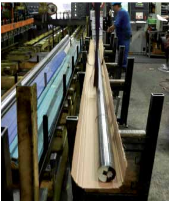
Vollflächige Ummantelung wertvoller und sensibler Einzelteile