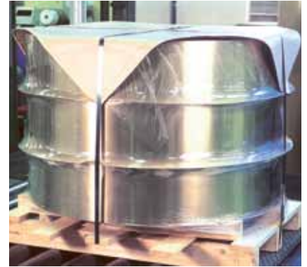
Leichte Alternative zu schweren Holzrahmen