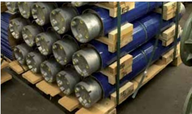
Solider Schutz bei optimierter Packdichte