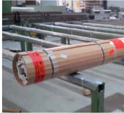
Absorbiert Stauchdruck und schützt vor Deformation