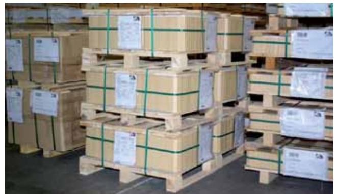
Waagerechte Ummantelung rechteckiger Produkte