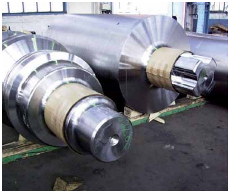
Partieller Schutz empfindlicher Walzenteile