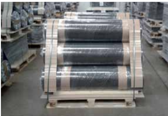
Schutz sensibler Rollenware

Je nach Bedarf schützen Nolco Produkte Einzelgüter oder ganze Produktbündel.