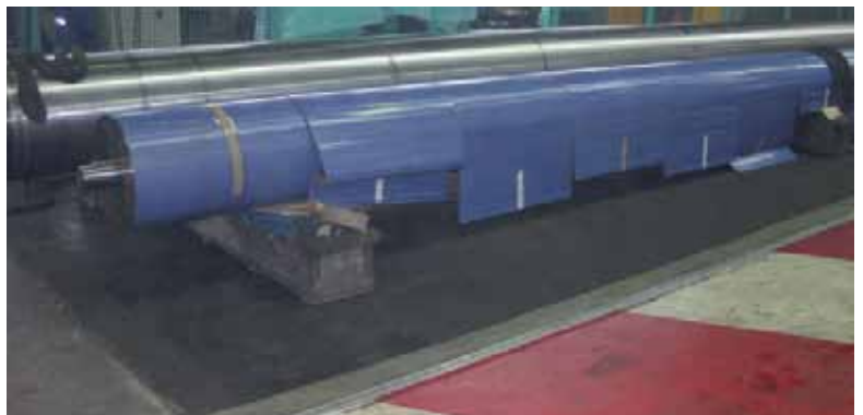
Schutz für lange Stahlwalzen